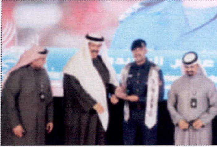
● المضيف مكرماً أحد الفائزين