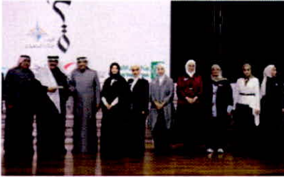
د.علي المضف وعميد كلية التربية الأساسية د.فريح العنزي وأعضاء مشروع همة

تحت رعاية وحضور مدير عام الهيئة العامة للتعليم التطبيقي والتدريب د.علي المضف أقامت كلية التربية الأساسية حفل انطلاق مشروع همة التربوي بعنوان «همة لأنك المستقبل»، وذلك على مسرح الكلية بالعارضية.